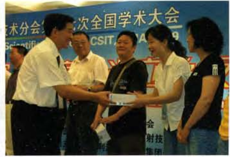
开幕晚宴暨当立之夜抽奖活动